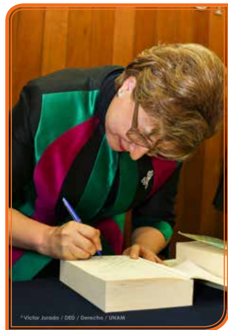
Ministra Margarita Beatriz Luna Ramos