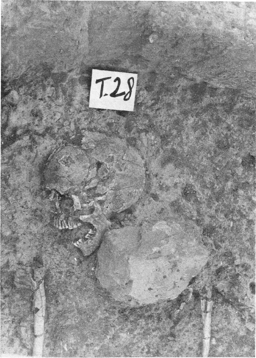
Figura 3. Tumba 28 de «La Joya». Individuo adulto, probablemente masculino.