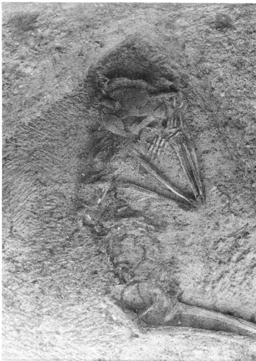
Figura 2. Tumba 26 de «La Joya». Individuo adulto, probablemente masculino.