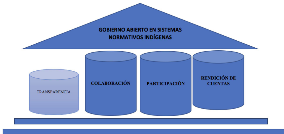
Figura 2. Gobierno Abierto y sus pilares en municipios de Sistemas Normativos Indígenas