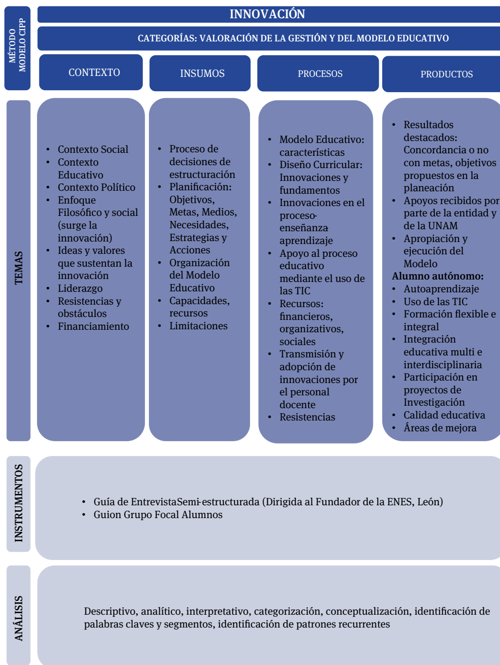
Figura 2. Descripción del Modelo CIPP para la valoración de categorías y temas de la investigación