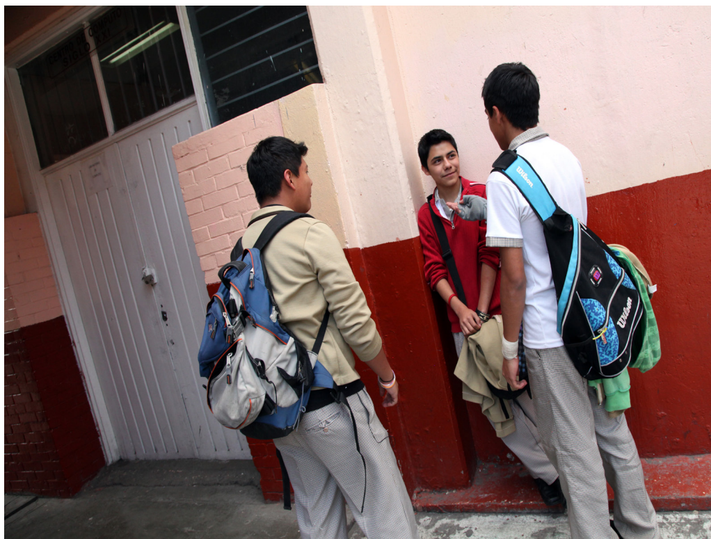
Escuelas, inmersas en entornos conflictivos.

En este punto, retomamos a Dubet (2005), cuando distingue un tipo de violencia que no es propiamente escolar, sino que viene de afuera e ingresa a la escuela; una violencia social que invade a las escuelas y las sacude, al enfrentarlas con problemas no escolares, como los de carácter psicológico o social para los cuales no tiene respuesta o no sabe cómo enfrentar (Guzmán, 2012).