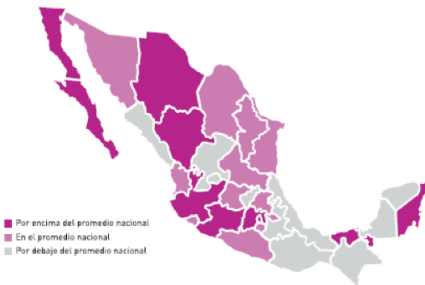
Figura 2. Clasificación de las entidades federativas de acuerdo a su promedio de violencia escolar, en secundarias (2008).

Fuente: Tomada de REDIM (2010), La violencia contra niños, niñas y adolescentes en México. Miradas regionales. Ensayo temático de La Infancia Cuenta en México 2010. Red por los derechos de la infancia en México, con base en INEE, 2009.