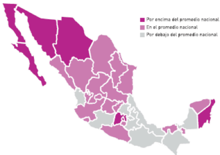
Figura 3. Clasificación de las entidades federativas de acuerdo a su nivel de violencia en los alrededores del plantel, en secundarias (2008).