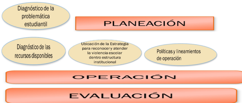
Cuadro 1. Planeación, operación y evaluación para detectar la violencia escolar. UNAM. (2012). Formación de coordinadores de programas institucionales de tutoría. Curso-taller "diseño, ejecución y evaluación colaborativa de planes de acción tutorial.