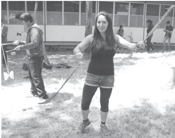
Autor: Daniel Gómez Martínez.

esta pregunta se divide con porcentajes similares entre desarrollar creatividad, diversión y pasar el tiempo. Por género se observa mayor frecuencia en el caso de mujeres a quienes les gusta más realizar actividades artísticas o culturales que a los hombres. Por semestre, edad y turno, los porcentajes de respuesta son muy parecidos. Por plantel, el Sur es donde se agrupan los mayores porcentajes en el gusto por realizar este tipo de actividades, alrededor de diez puntos porcentuales arriba del resto de los demás planteles.