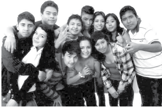
Autor: Daniel Gómez Martínez.

Se parte entonces de la importancia de conocer mejor a los jóvenes sobre todo en el contexto actual marcado por la fragmentación del vínculo social y la dilución del sentido de solidaridad intergeneracional; 3 así como el desvanecimiento de los marcos sociales tradicionales que en otros tiempos orientaban la acción de los individuos. 4 En efecto, aquellas estructuras sociales que antes orientaban las conductas, hoy en día, se han vuelto precarias lo cual ha derivado en la pérdida de sentido de la interacción social. Ahora corresponde al sujeto aislado dotar de sentido a sus acciones y pensar estrategias que le permitan lograr una frágil pero tolerable coordinación entre orden y subjetividad en un contexto de incertidumbre axiológica y simbólica, 5 “En pocas palabras, se deterioró la institucionalidad”. 6