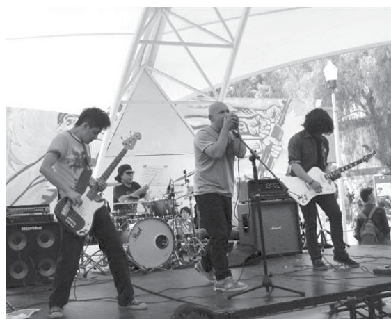
Autor: Daniel Gómez Martínez.

A favor de este anhelo de los padres está el ambiente escolar del Colegio. De acuerdo con Gimeno, 16 el ambiente escolar articula un conjunto de condiciones, objetos, prácticas y relaciones que generan la atmósfera particular que se respira en cada escuela y se traduce en aspectos tales como el sentido de pertenencia institucional, la confi-