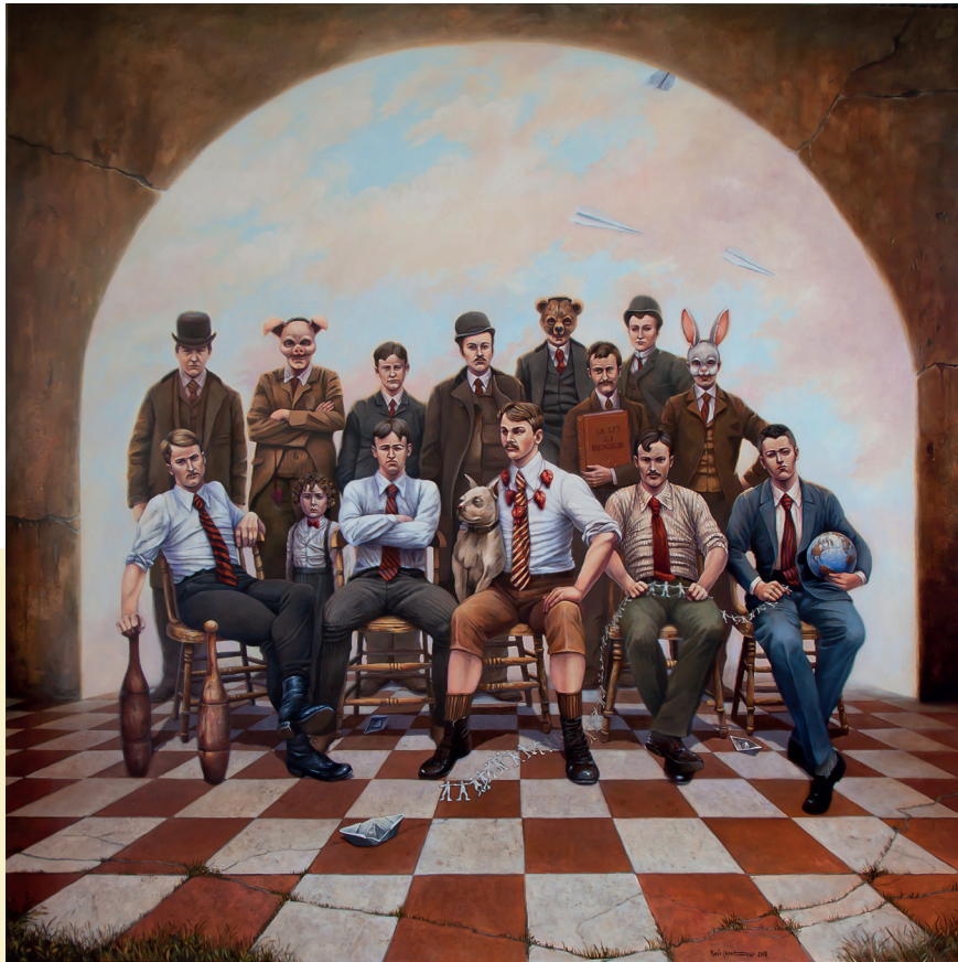
RETRATO DE FAMILIA