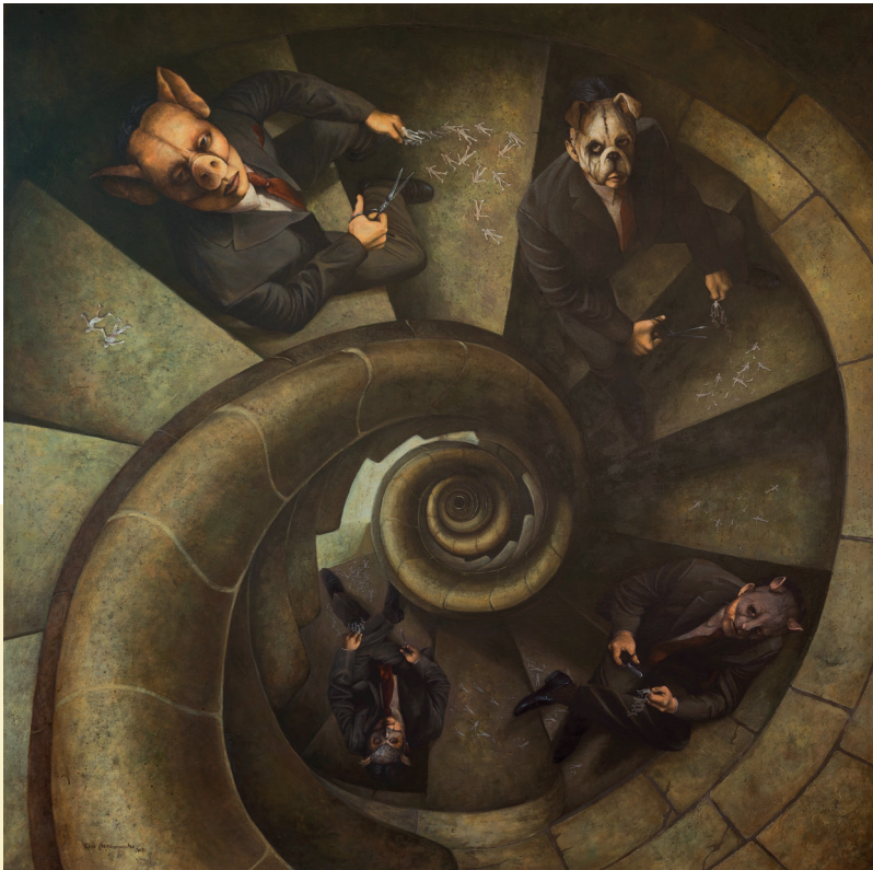
DE CRIMEN Y SIN CASTIGO