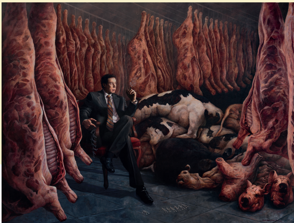
LECCIÓN 9: OMNIPOTENCIA