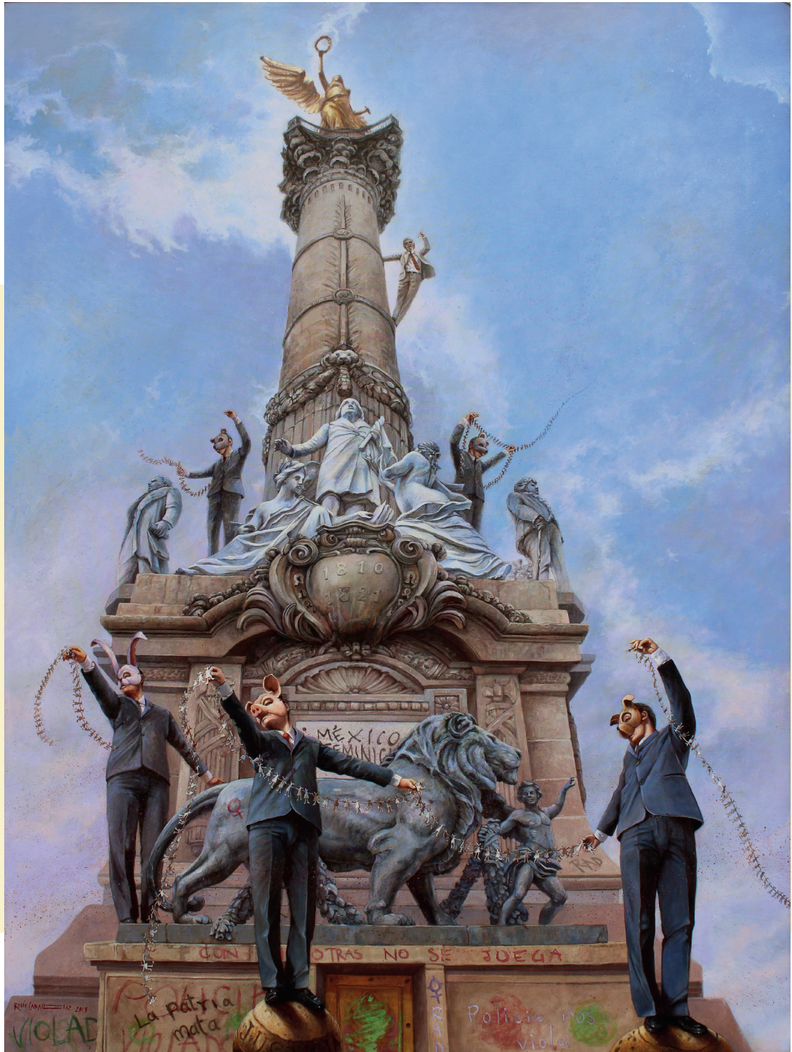
MÉXICO CREA EN TI