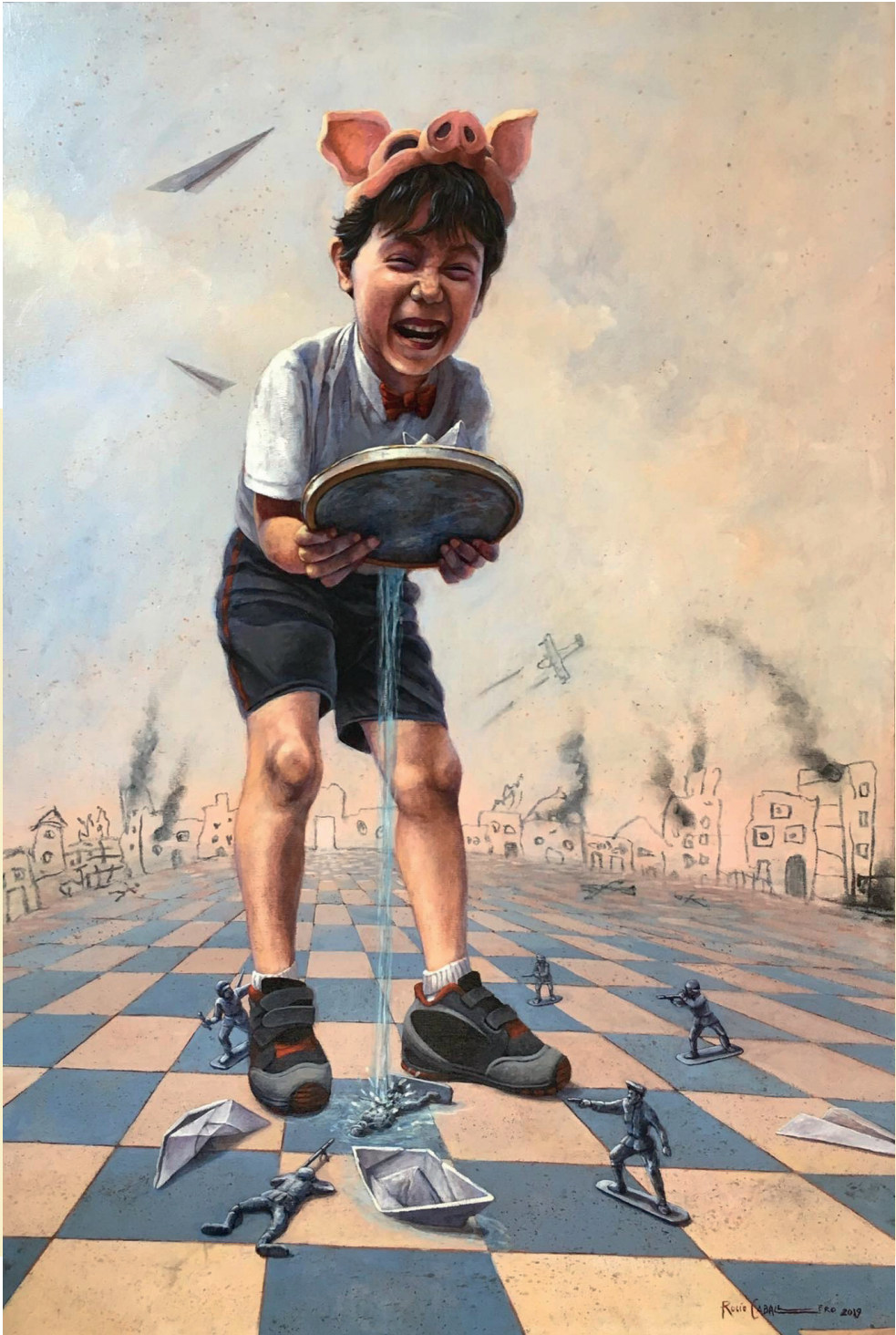
EN EL REINO DE YUPPIELAND II