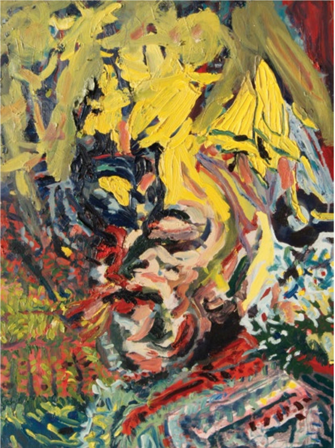
Retrato floripondio , 2013, óleo sobre madera.