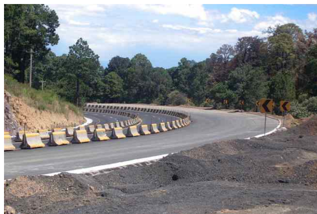
Figura 4. Fotografía de la segunda curva, durante la realización de los trabajos de mejoramiento

En México, el incremento de la seguridad vial mediante el mejoramiento de la infraestructura se ha buscado a través de la atención de puntos negros o tramos peligrosos, que es un programa de tipo correctivo; así como de la realización de auditorías de seguridad de carreteras en operación, que es un programa de tipo preventivo. La inversión anual en mejoramiento de las carreteras (construcción, modernización y conservación) asciende al orden de 0.25% del Producto Interno Bruto.