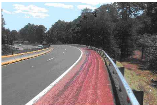
Figura 3. Fotografía de la segunda curva, durante la inspección de campo

La figura 3 muestra una vista desde el acotamiento externo hacia la salida de la segunda curva en sentido hacia Puebla, durante la inspección en campo.