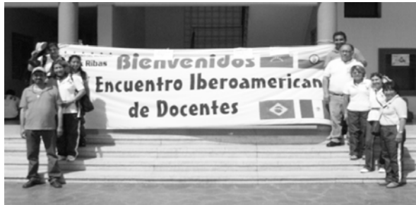
Expedicionarios de la FES-Aragón

La llegada a la Ciudad de Caracas fue el mismo día, permanecemos con dos días de antelación en Venezuela.