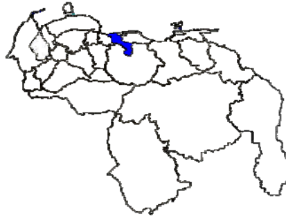
Ubicación del estado Aragua dentro del mapa de Venezuela

El estado de Aragua se encuentra ubicado en la región centro norte de Venezuela y la ruta tuvo lugar en Palo Negro, capital del municipio Libertador, se contó con la participación de 40 educadores delegados de cuatro países: Argentina, Brasil, Colombia y México, de los cuales asistieron un Argentino, tres Brasileños, treinta Colombianos, seis Mexicanos; más los maestros Venezolanos presentes en los diversos escenarios perteneciente a redes y diferentes organizaciones educativas.