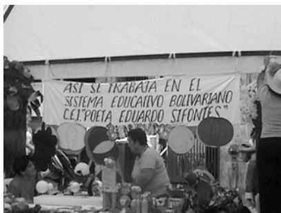
Exposiciones de trabajos manuales que los estudiantes hacen durante el ciclo escolar empleando recursos de su entorno.

Entonces la emoción tiene que expresarse y a veces basta una hoja de papel y una pluma, así surgió este pensamiento que se compartió en una plenaria pedagógica el 14 de julio del 2008 ante un grupo de profesores que debatían los aportes académicos de nuestras investigaciones.