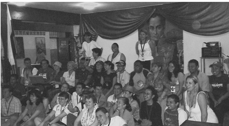
Expedicionarias y expedicionarios de la ruta "Misión Cultura Aragua"

Después de tener esta experiencia lo que se queda como aprendizaje en mi vida personal y para mi quehacer como maestro, es el verdadero sentido de lo humano, la importancia del trabajo en equipo, la integración, la tolerancia y la capacidad de contribuir de manera conjunta respetando las individualidades, además de un sinnúmero de propuestas pedagógicas-didácticas validadas, reflexiones e ideas para enriquecer nuestra labor e igualmente la oportunidad de trabajar en Red a nivel de América Latina.