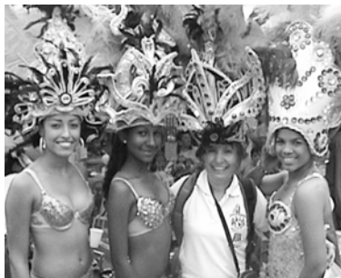
Danzas regionales y vestuarios

filosofía, haciendo de sus exposiciones pedagógicas una gran celebración para nosotros los visitantes; sus hermanos latinoamericanos .