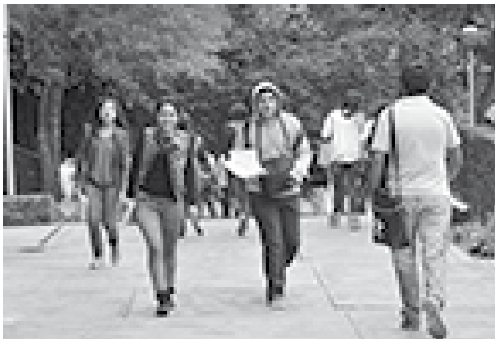
Fotografía: Archivo Histórico del Colegio de Ciencias y Humanidades. SCI 2015.

Colegio de Letras Clásicas –algún día podré leer los libros de latín que dejó mi abuelo en el rancho de la Concepción, Guanajuato, pensaba mientras levitaba por los pasillos de la Facultad de Filosofía y Letras–. Aprendí poco latín, poco griego, un mínimo latín medieval, literatura latina y griega, medianamente, casi nada de lo demás. Mi disciplina –digo mi disciplina porque es hasta la Universidad que comencé a diseñar mis técnicas de estudio– exigía sólo los conocimientos de mi interés; además, de los lugares apropiados para el estudio, ‘no biblioteca’ estaba estipulado. Con la guía de mi asesor de tesis de licenciatura, comprendí que ningún