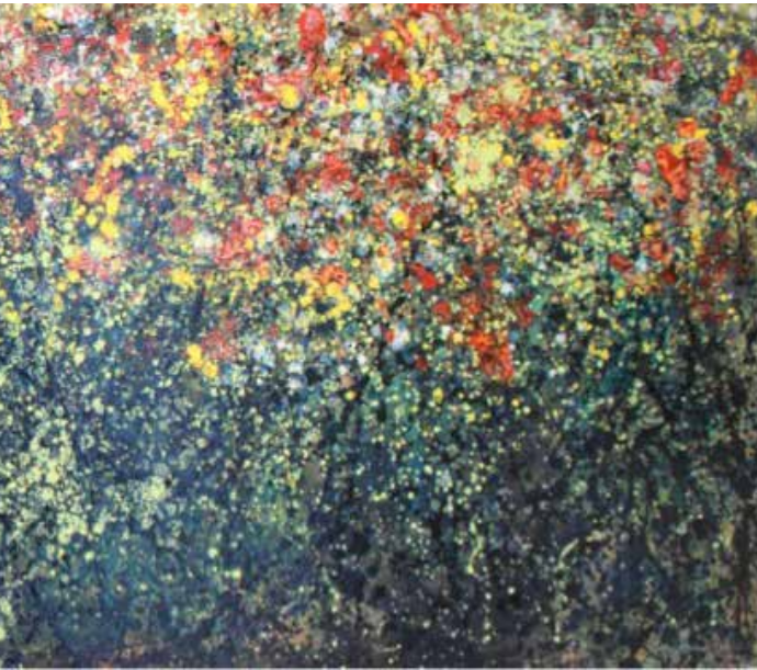
EN PLENA PRIMAVERA

ambientales y sus causas. Se recomendó que la educación centrara sus recursos en esta situación, mediante programas de educación ambiental. Aquí se comienza a visualizar la problemática ambiental como resultado de los procesos de desarrollo y comienzan a buscarse conceptos alternativos de desarrollo, surgiendo la idea de ecodesarrollo propuesta por Maurice Strong, promovida entre los años 1980 y 1982. En este cónclave internacional, se pondera la importancia del establecimiento de un programa sobre educación ambiental para la sociedad mundial, con la finalidad de contribuir a la protección de la naturaleza (Valdés, 2009).