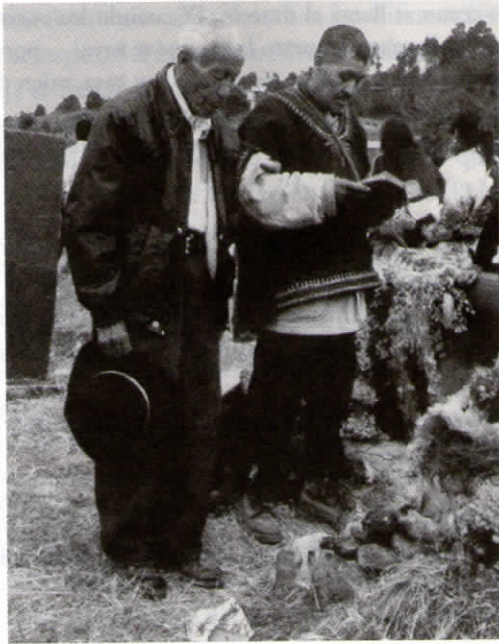
Dos maxtoles ante la tumba