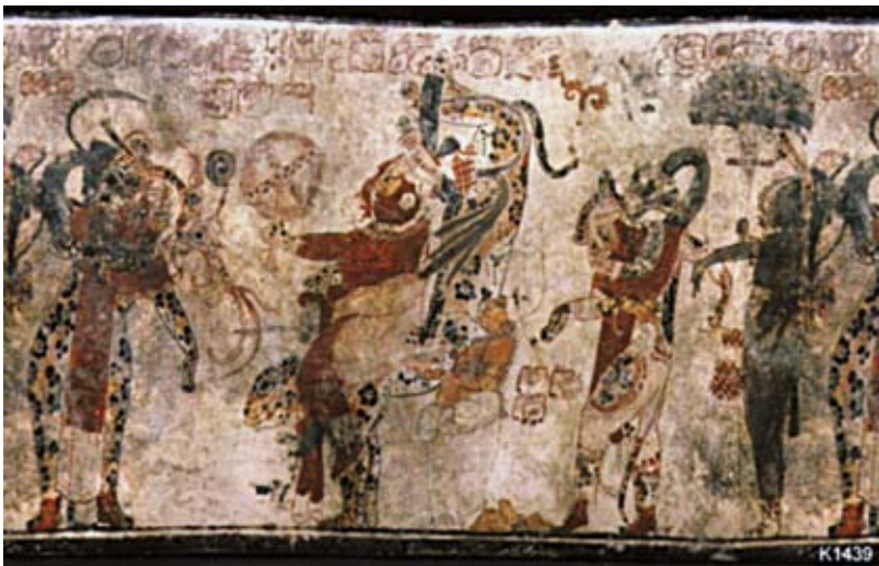
FIGURA 8A. K1439