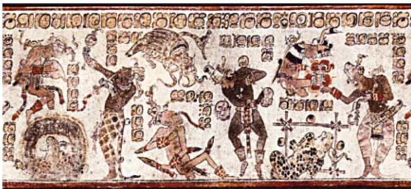
FIGURA 5. K791