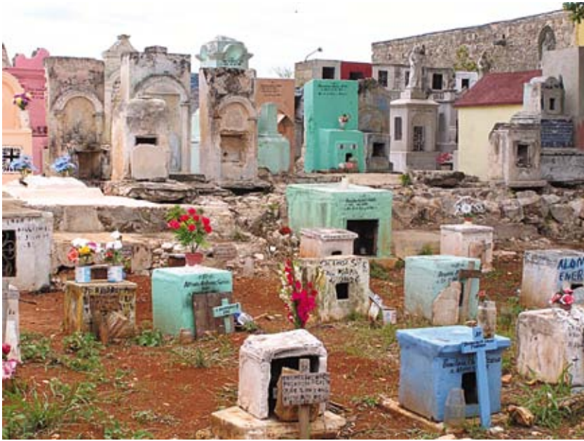
FIGURA 5. Cementerio de Tekit (Yucatán, México).