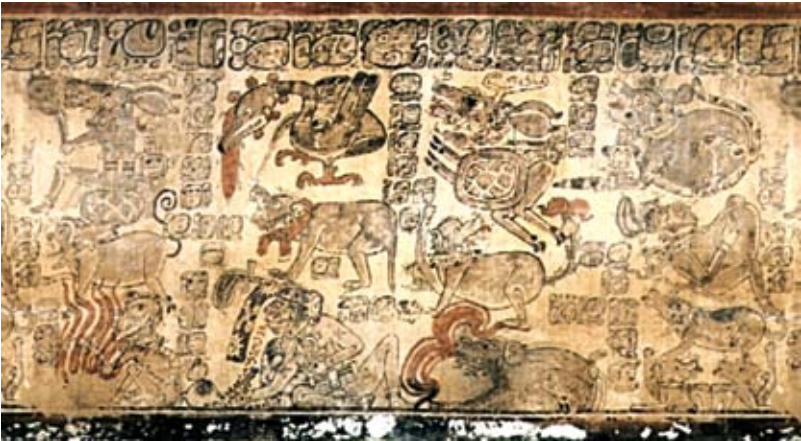
FIGURA 2. K927

“La instrumentalización del way según las escenas de los vasos pintados” SEBASTIAN MATTEO Y ASIER RODRÍGUEZ MANJAVACAS