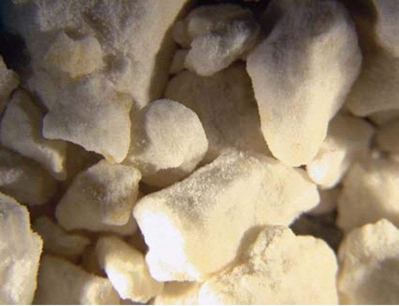
FIGURA 7. Blanco de cal visto a través del microscopio óptico.