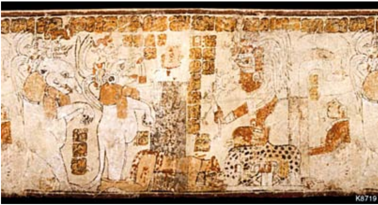
FIGURA 11. K8719