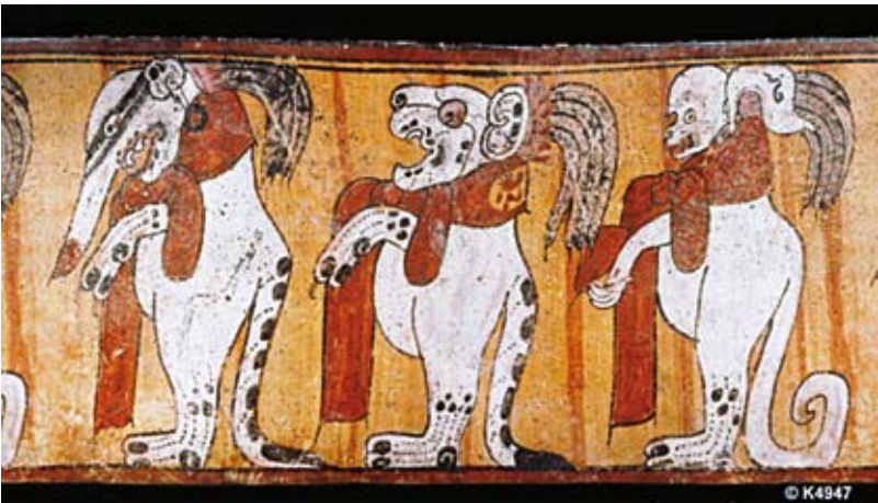
FIGURA 3. K4947 (© Justin Kerr)