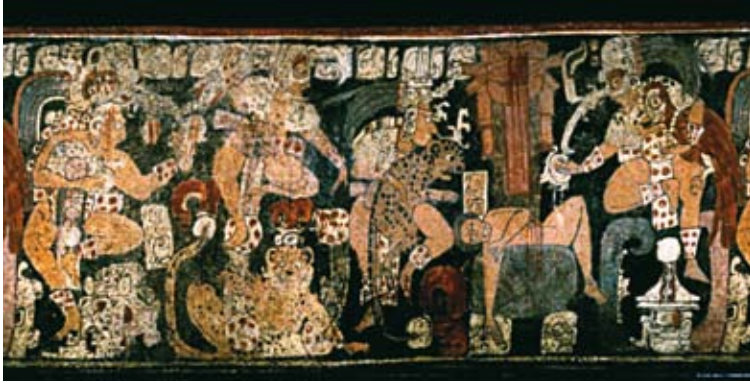
FIGURA 10. K8351