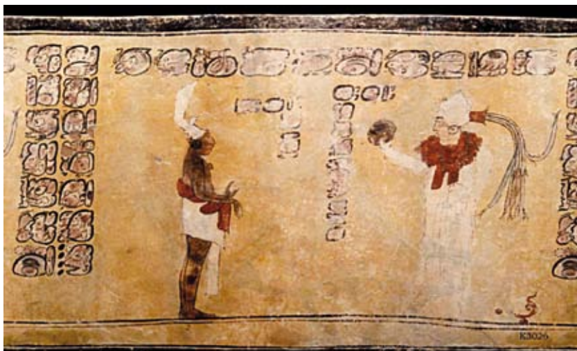
FIGURA 6. K3026