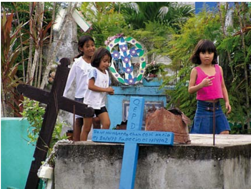
FIGURA 6. Cementerio en Santa Elena (Departamento de Petén, Guatemala).