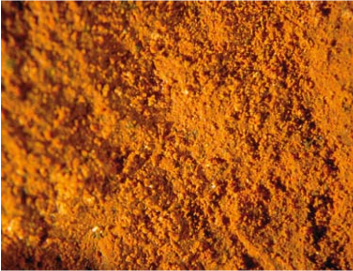
FIGURA 8. Hematita vista a través del microscopio óptico.