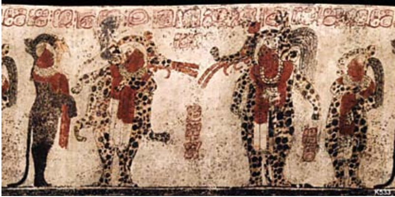
FIGURA 7A. K533