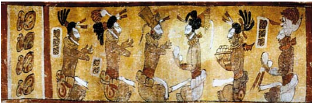
FIGURA 10. Foto catálogo Kerr (Inv. nº K6067).