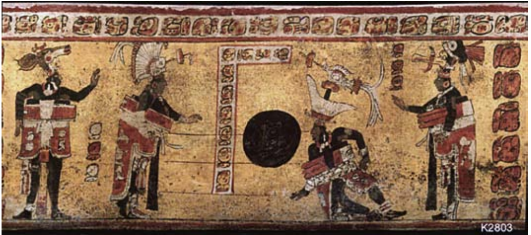
FIGURA 9. Foto catálogo Kerr (Inv. nº K2803).