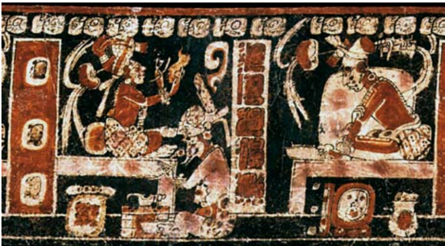
FIGURA 11. Foto catálogo Kerr (Inv. nº K717).