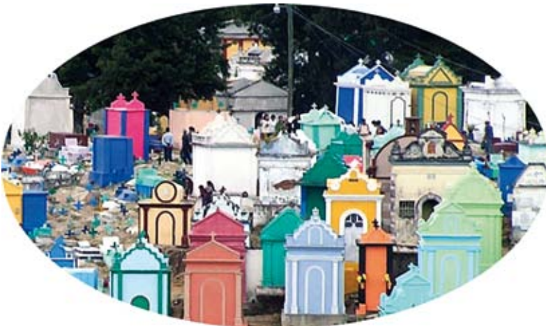
FIGURA 1. Cementerio de Chichicastenango (Altiplano de Guatemala).

“El color y lo funerario entre los mayas de ayer y hoy...” M a LUISA VÁZQUEZ DE ÁGREDOS PASCUAL