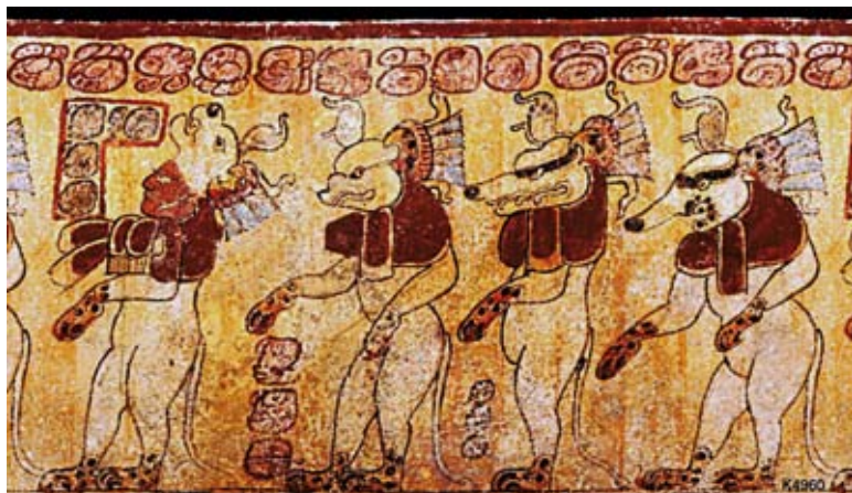
FIGURA 4. K4960