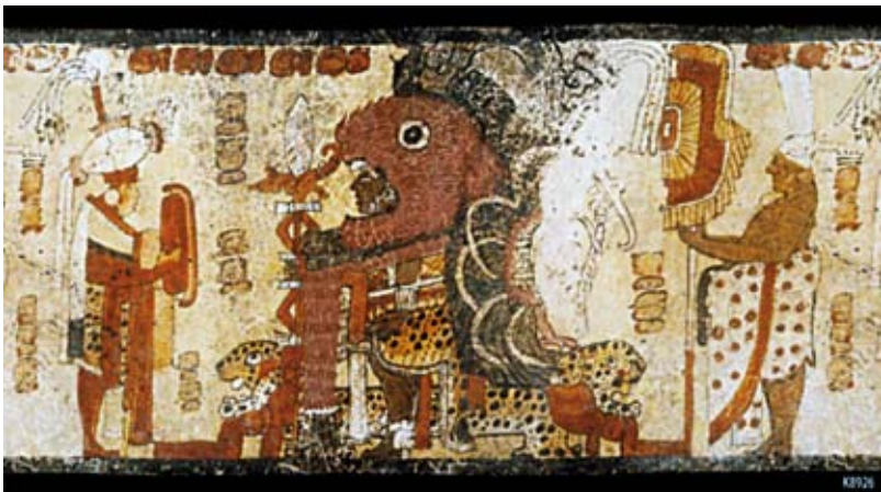
FIGURA 9. K8926