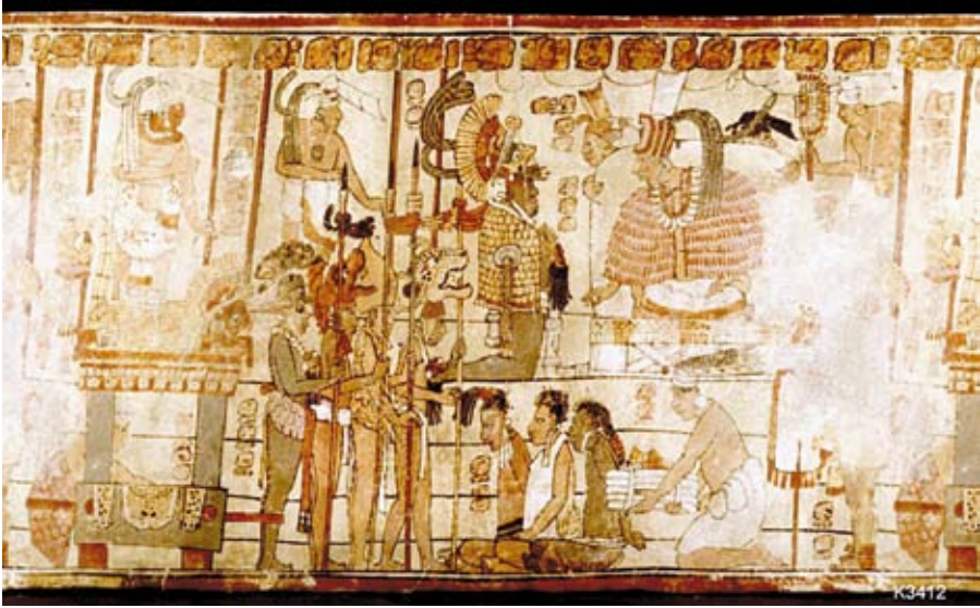
FIGURA 12. Foto catálogo Kerr (Inv. n° K3412).

“Renovando el pacto con los dueños. Consideraciones etnográficas sobre las fiestas de San Diego y el hanliko’ol en una comunidad maya de Campeche” DAVID DE ÁNGEL GARCÍA