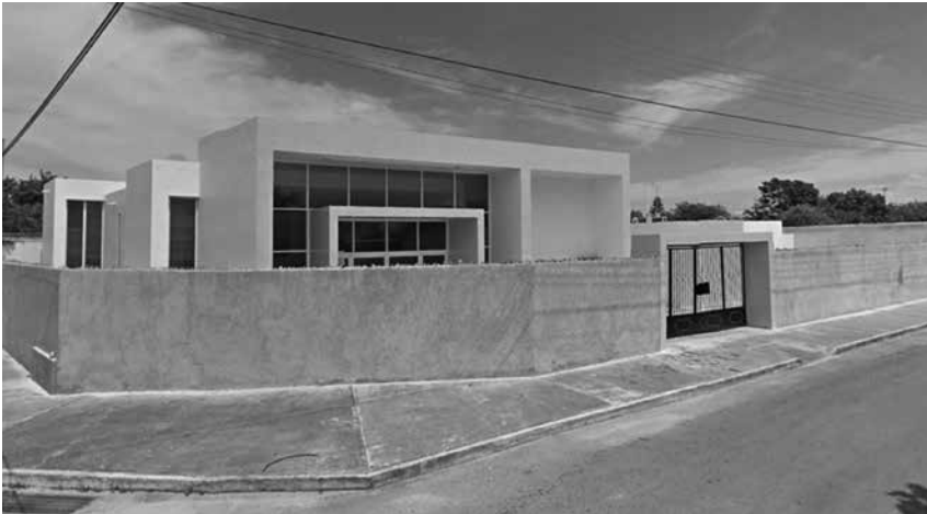
Imagen 2. Templo “Monte de los Olivos”, ubicado en la colonia Salvador Alvarado Oriente de la ciudad de Mérida, Yucatán.

Estos factores obedecen a las propias características de la ciudad de Mérida; en ella se expresa una marcada diferencia entre las zonas norte y sur. Mientras aquel posee mejores servicios e infraestructura, el sur se distingue por tener una alta marginación urbana. De esta manera, siete de los ocho templos espiritualistas de la ciudad de Mérida se ubican precisamente en las colonias que presentan más carencias.