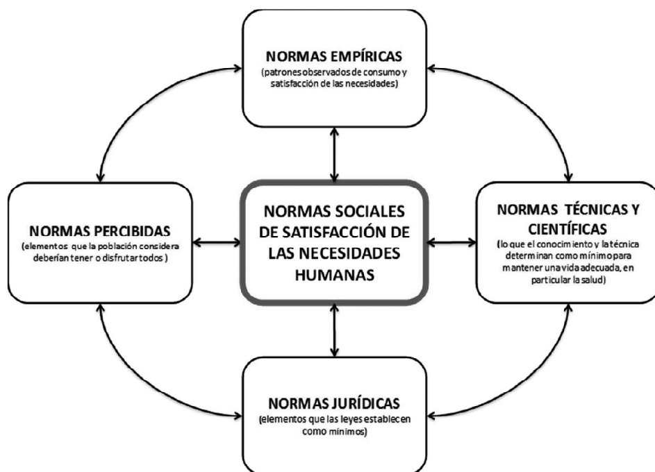
Figura 3 Elementos a considerar en la identificación de las normas de satisfacción mínima de las necesidades humanas (umbral de pobreza)