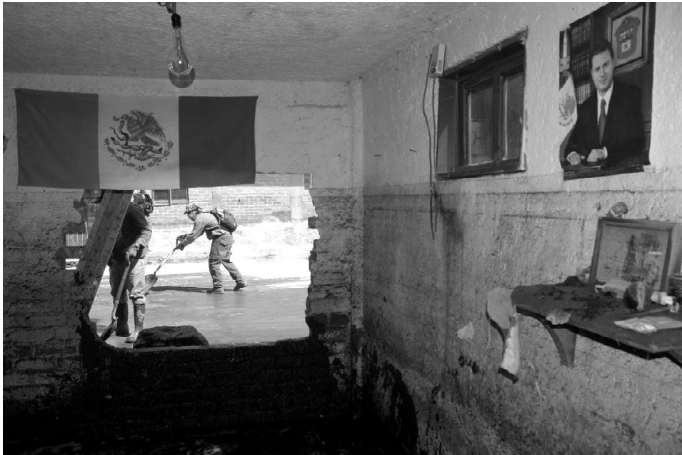
Fotografía: Jair Cabrera, Cochoapa, Guerrero, 26 de enero de 2011.