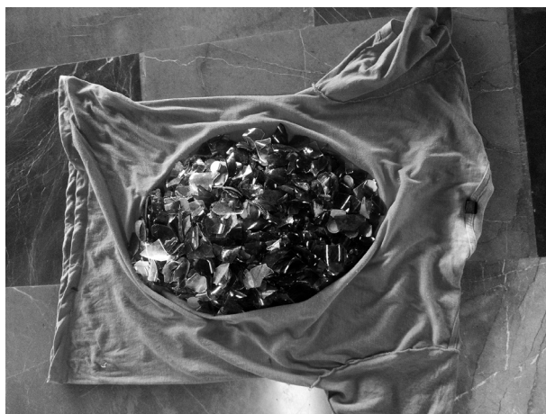
Imagen 2 Playera con vidrios y algunas monedas