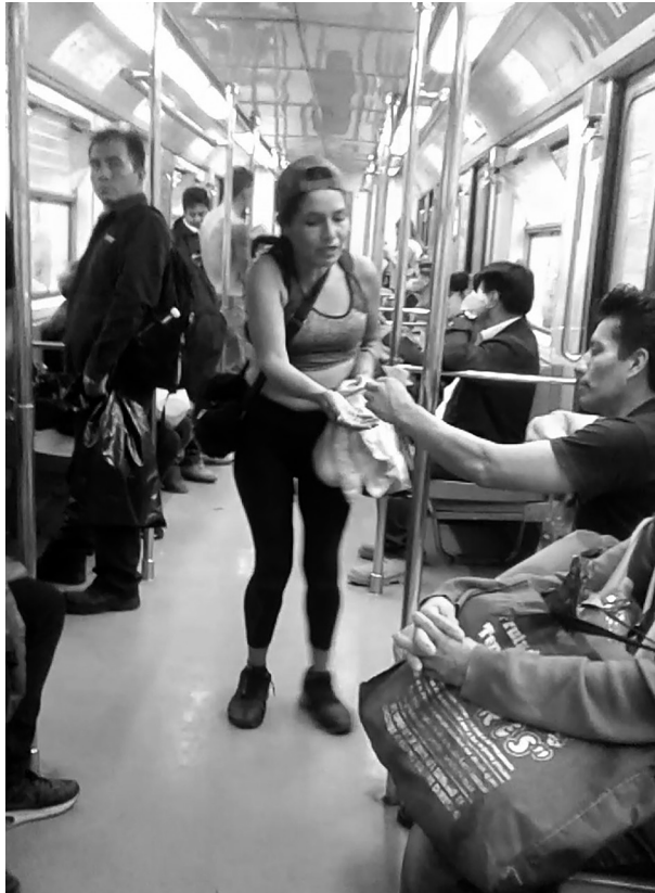
Imagen 3 Usuario retribuye el acto de faquir

Fuente: toma propia, 26 de diciembre, 2019.