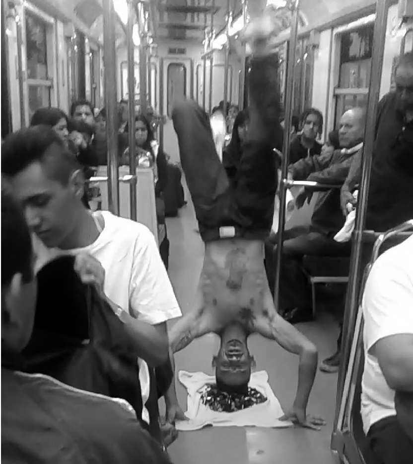
Imagen 1 La puesta en escena del faquir

Fuente: toma propia, 14 de diciembre de 2019.