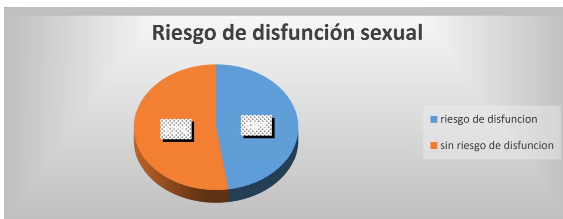
Grafico 3. Frecuencia relativa de estudiantes en riesgo de desarrollar disfunción sexual.

El riesgo de presentar disfunción sexual, considerando el valor de corte que establece el instrumento, estimado para puntuaciones medias del Índice General de Disfunción menores de 26, se describe en el grafico 3.