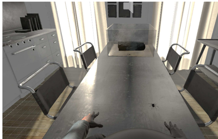
Figura 3. Entorno Arañas

Arañas. Esta escena incluye un gran apartamento. Desde la perspectiva de los participantes, una gran sala de estar era visible a la derecha y un pasillo detrás de los sujetos. La exposición tuvo lugar en la cocina donde los sujetos estaban sentados al final de una mesa (3m x 1m). En el extremo opuesto de la mesa había una pecera rectangular, dentro de ésta, una cortina enrollada funciona como un obstáculo visual que no permite ver las arañas hasta el comienzo de la secuencia. Para aumentar la sensación de presencia, se colocó un cuerpo avatar virtual sin cabeza en la silla con ambas manos abiertas sobre la mesa (con las palmas hacia abajo). El punto de vista de los sujetos estaba situado por encima del cuello del avatar virtual. Cuando iniciaba la experiencia virtual, se abría el frente de la pecera y comenzaba una secuencia predefinida en que las arañas se desplazaban sobre la mesa hacia el sujeto, deteniéndose a 5cm de distancia de las manos virtuales.