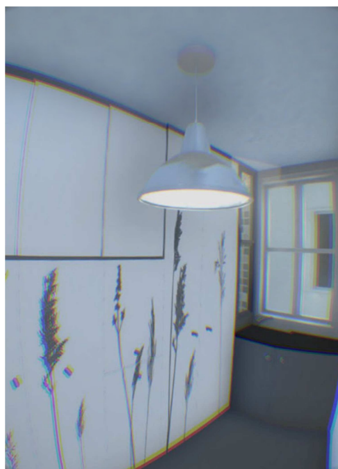
Figura 2. Entorno Departamento

Departamento. El escenario es formado por un pequeño departamento modular que consta de una superficie de 2m por 4m. Dentro de esta área, había una bacha, un baño de 1m x1m cuya vista estaba oculta por una puerta y un armario de 3m incrustado en la pared.