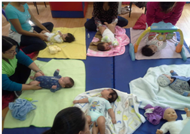
Figura 1. Madres en la sesión de masaje

Esta relación que empieza siendo con quien en ese momento acompaña al bebé y el bebé mismo, es monitoreada y modelada por la Dra. Blanca. Mientras les explica cómo hacer el masaje (piernas, pies [dedos o palma]), modelándoles con su muñeco, por decir algo, las cuidadoras ya están preparadas con el bebé frente de ellas; posibilitando la mirada mutua pero también la cercanía, el tacto y el contacto. Sin ser invasiva, pero al mismo tiempo poniéndose por centro de la atención del bebé, aunque la movilidad de la cara y la situación misma que no están solos sino con otros cuidadores haciendo lo mismo, el bebé entra en relación con otros adultos y otros bebés. Las personas adultas por supuesto que también entran en relación con la Dra. Blanca, con el personal de apoyo de ésta, con las otras personas cuidadoras que acuden a lo mismo y con otros bebés. Es un espacio enormemente rico en interacciones personales que en su momento se verá todo lo que esto implica. Por lo pronto la fotografía que incluimos nos sirve para ilustrar lo que decimos y producto de la observación participante.