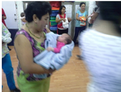
Figura 2. Momentos después del masaje.

Esa relación intermedia acciones con objetos, y con todo propósito para que los bebés desarrollen su sensibilidad visual, auditiva y táctil; su psicomotricidad, como base complementaria y quizá el fondo inicial bajo el cual se crea este espacio, pero que se ha expandido en su acción sin que necesariamente haya sido planeado. Son efectos propios de la acción en situación. Ésta es enormemente importante para lo que hemos dicho, pero lo será también para lo que se verá enseguida. Y nos vamos a referir a dos tipos de actividades: a) el saludo y la despedida; muy parecidos en términos de actividad pero que son momentos totalmente diferentes y les precedieron igualmente situaciones totalmente diferentes. Y b) los cantos y juegos después de los masajes y la estimulación sensoriomotriz y antes de la despedida.