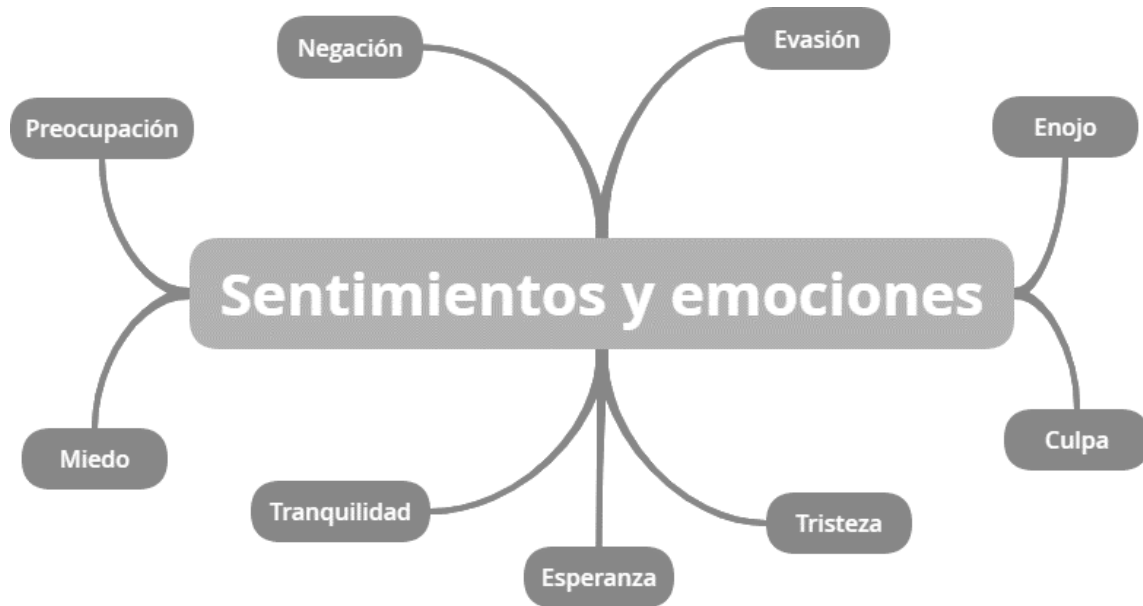
Figura 2. Sentimientos y emociones.

Luego de la aplicación y análisis de las lexias derivadas de las entrevistas a profundidad a los cuatro adultos jóvenes, se obtienen los siguientes resultados: