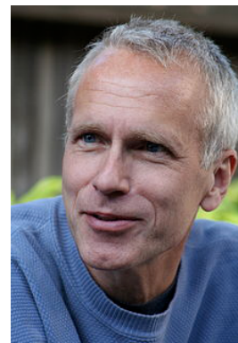
Figura 3. Brian Kobilka.

ciclasa y los alfa 1 (también con tres isoformas: alfa 1A, 1B, 1D ), que se acoplan al sistema de recambio de fosfoinosítidos, producción de inositol 1,4,5-tri-fosfato y movilización de calcio (Hoffman, 2001; Nelson & Cox, 2008; International Union of Basic and Clinical Pharmacology Database, 2012). Estos receptores están codificados por diferentes genes en distintos cromosomas y con expresión diferencial en los tejidos. Existen agonistas y antagonistas selectivos para cada subtipo, lo cual tiene una enorme importancia en la terapéutica cotidiana (Hoffman, 2001; Nelson & Cox, 2008; International Union of Basic and Clinical Pharmacology Database, 2012).