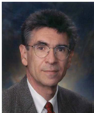
Figura 2. Robert Lefkowitz

descubierto que el AMP cíclico es un mensajero intracelular, que se produce en respuesta a muchas hormonas y neurotransmisores, por lo que recibió el Premio Nobel. Cuenta Lefkowitz (1983) que, tras muchas dificultades, logró marcar la hormona y determinar su asociación a las membranas (Lefkowitz, et al. , 1970). Este trabajo fue muy importante pues permitió cuantificar a los receptores e iniciar la valoración real de su afinidad por las hormonas. Al trabajo siguieron consideraciones sobre la aplicabilidad del método para cuantificar los receptores para otras hormonas peptídicas (Lefkowitz, 1983), es decir, se inició la época de la cinética no catalítica de asociación de ligandos a receptores hormonales (el famoso “binding”, de moda en los años 80 y 90 del siglo pasado).