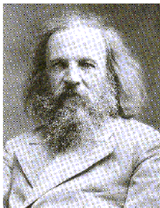
Figura 1. Dimitri I. Mendeleiev.

M e van a perdonar el atrevimiento de poner en un pedestal a la madre de Mendeleiev pero, no sé, quizá conforme uno crece va sentando conciencia del papel cardinal de las madres y los padres en la vida de las personas.