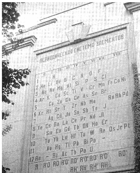
Figura 2. Tabla periódica en una pared del Bureau de Pesas y Medidas de San Petersburgo.

A partir de 1855, a sus 21 años, Dimitri tomó un puesto de profesor de ciencias en la escuela Simferopol de la península de Crimea. Al poco tiempo cerró la escuela, por la guerra en esa región, y fue transferido a otra, en Odessa, en la que se involucró crecientemente en la investigación. Después de dos años de investigación doctoral en la Universidad de San Petersburgo, las autoridades le entregaron una beca para estudiar en París, con Henri Regnault, y con Robert Bunsen, en Heidelberg. En este viaje Mendeleiev acumuló una enorme cantidad de datos, hizo mediciones sobre gases y aprendió la nueva técnica de la espectroscopia. En 1860 asistió junto con el músico-químico Alexander Borodin al Con-