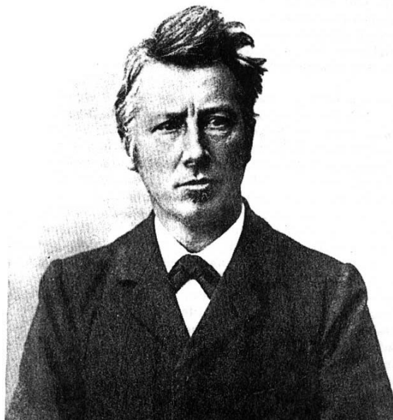
Figura 3. Jacobus Henricus van't Hoff (1852-1911).