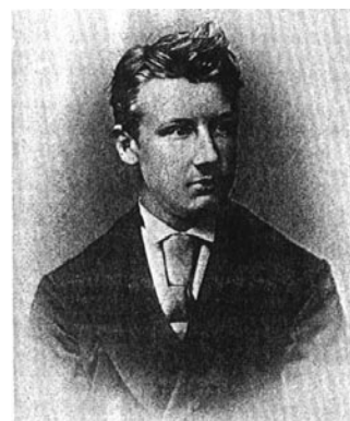
Figura 1. J.H. van't Hoff como estudiante en Bonn, en 1873.

Hay que recordar que el concepto de valencia, especialmente como se aplicó a átomos de compuestos orgánicos u organometálicos, se había vuelto de