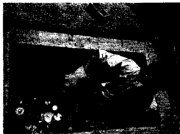
Figura 6. Enterrado de productos tóxicos en el Colegio Madrid, de acuerdo con las recomendaciones de la American Chemical Society (ACS, 1985) (Catalá, 1992).

El método general 4 que corresponde a la descripción de DISOLVENTES EN VOLÚMENES MAYORES QUE un litro, se aplica a todos los disolventes orgánicos que se acumulen en el laboratorio, ya sea con residuos o no. En este caso, el método sugiere almacenarlos en garrafrones para su recuperación o incineración por parte de alguna institución, industria o dependencia adecuadas, ya que no se recomienda hacer combustiones de volúmenes tan elevados.