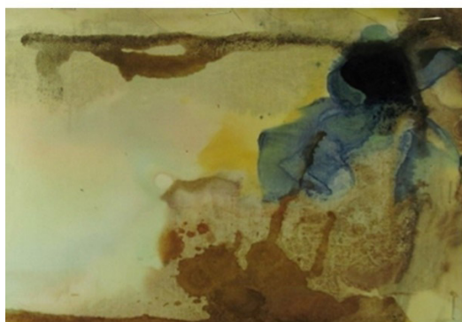
Figura 1: Arte do aluno A: Ferricianeto de Ferro II – AZUL ESCURO; Bicarbonato de Cobre II – AZUL CLARO; Bicarbonato de Cobalto – ROSA ESCURO AVERMELHADO.

As figuras 1 e 2 exemplificam as obras produzidas. Nas legendas está a identificação dos precipitados formados, em função das cores obtidas. Esses precipitados, como se poderá ver adiante, puderam ser reconhecidos por terem sido anotados os reagentes adicionados ao pano.