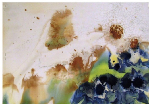
Figura 2: Arte do aluno B: Tiocianato de Ferro II – MARROM; Hidróxido de Cobre II – AZUL CLARO; Ferricianeto de Ferro II – AZUL ESCURO.

Queremos reafirmar que tivemos a produção de uma arte-surpresa , possível por terem sido empregadas substâncias cujas cores não eram as que surgiram nas telas; arte que partiu da experiência com a arte; arte-fenômeno , instigante e provocativa, aberta a manifestações de interesse e curiosidade acerca das transformações materiais que a constituíram.