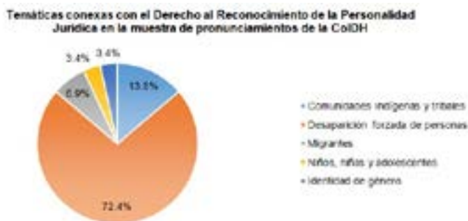
Figura No. 02 – Providencias de la CoIDH organizadas por temáticas conexas al derecho al reconocimiento de la personalidad jurídica.

Así las cosas, se puede advertir que, al interior de los casos contenciosos de la CoIDH, se identifican como temas esenciales en relación al derecho abordado: Por una parte, situaciones fácticas relacionadas con el fenómeno de la desaparición forzada de personas; por otra parte, aquellos que se relacionan con comunidades indígenas o tribales; y, de una manera más reducida, se encuentran el asunto afín a migrantes; los cuales se integran a los temas de las opiniones consultivas (niños, niñas y adolescentes; e identidad de género). Estos resultados pueden ser concretados gráficamente de la forma subsecuente: