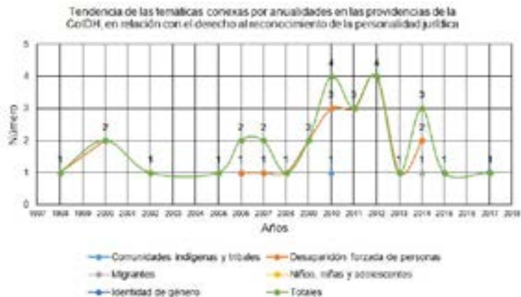
Figura No. 03 – Tendencia de las temáticas conexas por anualidades en las providencias de la CoIDH, en relación con el derecho al reconocimiento de la personalidad jurídica.