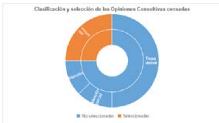
Figura No. 01 – Clasificación y selección de las Opiniones Consultivas censadas.

Debido a los índices de confiabilidad encontrados, habiendo establecido, conjuntamente, que los casos con más frecuencia estaban presentes, se dio preponderancia (siguiendo, asimismo, los límites de páginas que se ostentan) a los resultados de 37 pronunciamientos de casos contenciosos realizados por la CoIDH de su propio buscador.