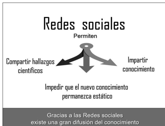
Figura 1. Aspectos que permiten las redes sociales en la educación (Medina, 2019).

un diseñador de ambientes de aprendizaje, tiene la capacidad de rentabilizar diferentes espacios y entornos adecuados para la producción del conocimiento. Es necesario crear oportunidades innovadoras que motiven y atraigan la atención de los estudiantes al mejorar su desempeño y aprovechamiento.