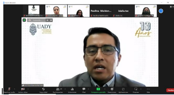
Conferencia "Herramientas digitales, un aliado para la práctica docente".