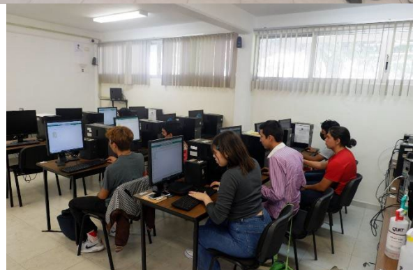
Taller de Herramientas Office 365