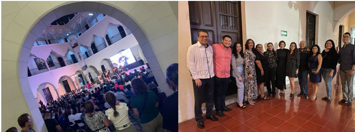
Centro Cultural Universitario. Concierto de Los Juglares