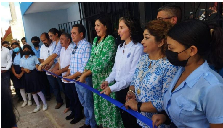
Inauguración del Aula Virtual de Dzoncachuich, Yucatán.

En este 2022, un nuevo proyecto se sumó a la atención al rezago educativo, pues se instituyó la colaboración oficial de la Secretaría de Educación del Gobierno del Estado (SEGEY) para la implementación de cuatro aulas virtuales, en las que se impartirá el programa del BeL, en los municipios de Tetiz, Dzoncachuich, Chumayel y San Felipe. Este nuevo convenio ofreció la oportunidad a 100 estudiantes de dichas localidades para iniciar o continuar sus estudios de bachillerato. De igual forma, el 2023 se vislumbra como un año en que el BeL continuará contribuyendo de manera significativa en ampliar la cobertura educativa en el estado, ya que el gobierno ha proyectado implementar, en colaboración con la UADY, 22 aulas virtuales más.