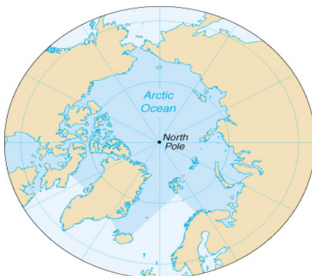
Figura 1 El Ártico: un océano congelado

El Ártico es una de las zonas más militarizadas del mundo. En la guerra fría, tanto Estados Unidos como la URSS hicieron del área la muestra más palpable de la disuasión. El daño ambiental en el Ártico es muy grande y ello reclama un esfuerzo en materia de cooperación entre los ocho países y las comunidades indígenas que habitan y tienen soberanía en la región.