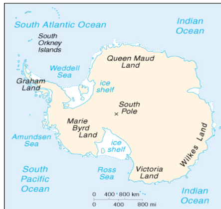
Figura 3 La Antártica o terra australis incognita

La Antártica es un territorio cuyo reparto se mantiene inconcluso. Ello reviste especial interés porque los reclamos soberanos no sólo involucran a países del hemisferio sur, sino a influyentes potencias localizadas en el hemisferio norte.