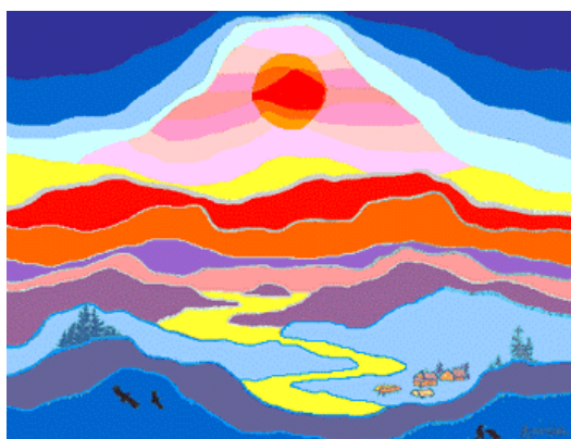
Figura 2 El emblema del Consejo Ártico

El emblema del Consejo Ártico representa los paisajes más comunes de lo que Hans Ruesch denominaba “el país de las sombras largas” o “la cima del mundo” ( top of the world ): el sol de medianoche en los veranos, y la oscuridad permanente en los inviernos.