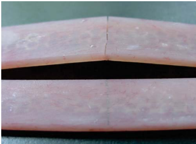
Figura 5. Se puede observar que las muestras se han roto una vez que se sometieron a carga.

el grupo «B» fue de 2.717 mm ± .5520, para el grupo «C» de 3.462 mm ± .650 y para el grupo «D» de 2.382 mm ± .307 (Figura 6).