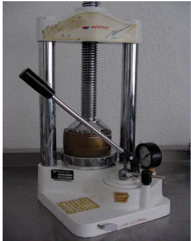
Figura 2. Se observa la prensa que se utilizó, en donde la mezcla de acrílico se prensó a 10 lb/in 2 .

Las muestras fueron elaboradas con la técnica a cera perdida con cera rosa en láminas (Filenes de México). Se enmuflaron con yeso tipo IV (Velmix, Whip Mix USA) en muflas Hanau (Hanau) ( Figura 1 ). Una vez fraguado se desenceró, sumergiendo las muflas por 12 minutos en agua a temperatura de ebullición (92.8 °C en la Ciudad de México), por 8 minutos en una unidad de curado Hanau (Hanau) y se lavaron con detergente biodegradable. Una vez limpio y seco el yeso, se pincelaron dos capas con separador de yeso-acrílico (Nic Tone Manufacturera Dental Continental, México) dejándolo secar por 10 minutos. Se realizó la mezcla de polvo-líquido con proporciones de tres partes de polvo por una parte de líquido en ambos acrílicos. Para el grupo «A» la mezcla de acrílico se colocó en los moldes hacedores de yeso tipo IV con papel celofán para ser prensado en una prensa hidráulica (Mestra) a 10 lb/in 2 . Se retiraron los excedentes de acrílico y se terminó de cerrar la mufla ( Figura 2 ). El procedimiento para el grupo «B» de Lucitone 199 con inserto metálico fue el siguiente: los insertos se cortaron con un disco de carburo fino (Keystone USA), con dimensiones de 8.5