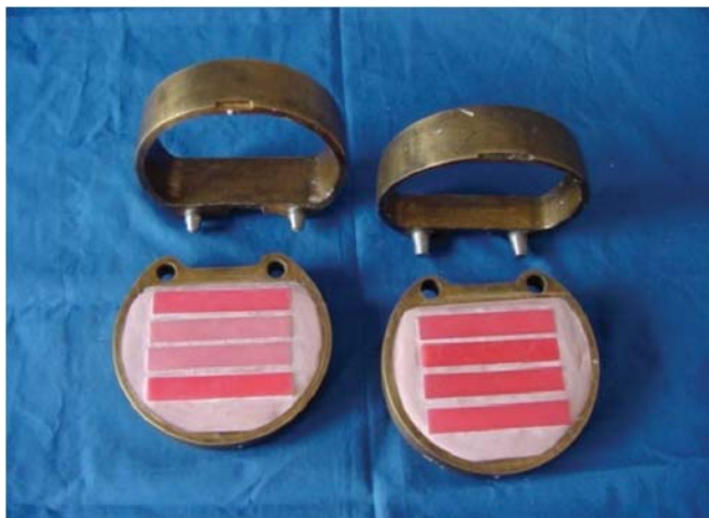
Figura 1. En la imagen se aprecian los patrones de cera en la mufla para las muestras con las dimensiones antes citadas.

Se realizó un estudio experimental formado por cuatro grupos con diez muestras cada uno, integrando 40 especímenes en total. El grupo «A» fue de acrílico Lucitone 199 ( Dentsply International Milford Delaware ) sin inserto metálico, el grupo «B» de acrílico Lucitone 199 con inserto metálico ( Dentaurum, Pforzheim, Germany ), el grupo «C» de acrílico ProBase Hot ( Ivoclar Schaan Liechtenstein ) sin inserto metálico y el grupo «D» de acrílico ProBase Hot con inserto metálico. Todas las muestras tuvieron las siguientes dimensiones: 10 mm de ancho por 65 mm de largo por 2.5 mm de grosor, cumpliendo el punto 4.3.5 de la especificación no. 12 de la ADA 10 para polímeros de bases de dentadura.