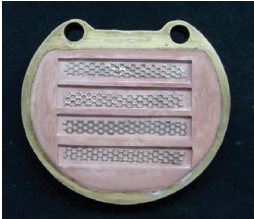
Figura 3. Se aprecian los insertos metálicos en la zona desencerrada o donde ocupó el espacio el patrón de cera listo para ser encapsulado en el acrílico.