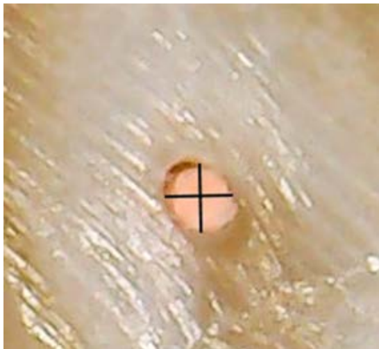
Figura 2: Sellado satisfactorio del cono de gutapercha correspondiente a los tres cuadrantes del foramen apical.

Ideal sealing of the gutta-percha single cone after mechanical instrumentation.