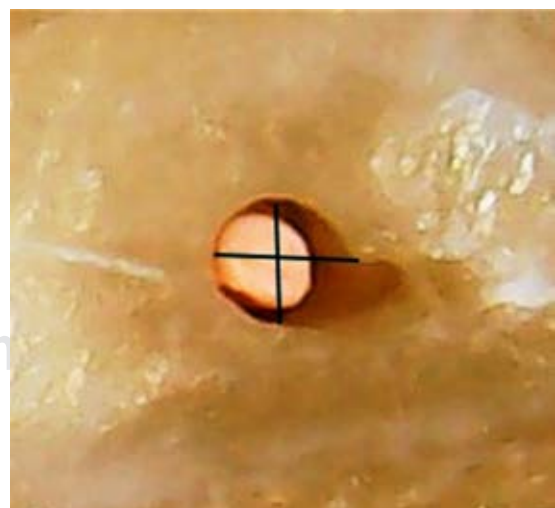
Figura 3: Sellado inaceptable del cono de gutapercha co-rrespondiente a dos o menos cuadrantes.

El método más ampliamente aceptado y utilizado para el llenado del conducto radicular después de la preparación de los conductos es mediante la compac-tación lateral fría de gutapercha en combinación con un cemento sellador. 27 En la actualidad, los fabricantes ofrecen una gran variedad de instrumentos rotatorios de níquel-titanio clasificados por diferentes caracterís-