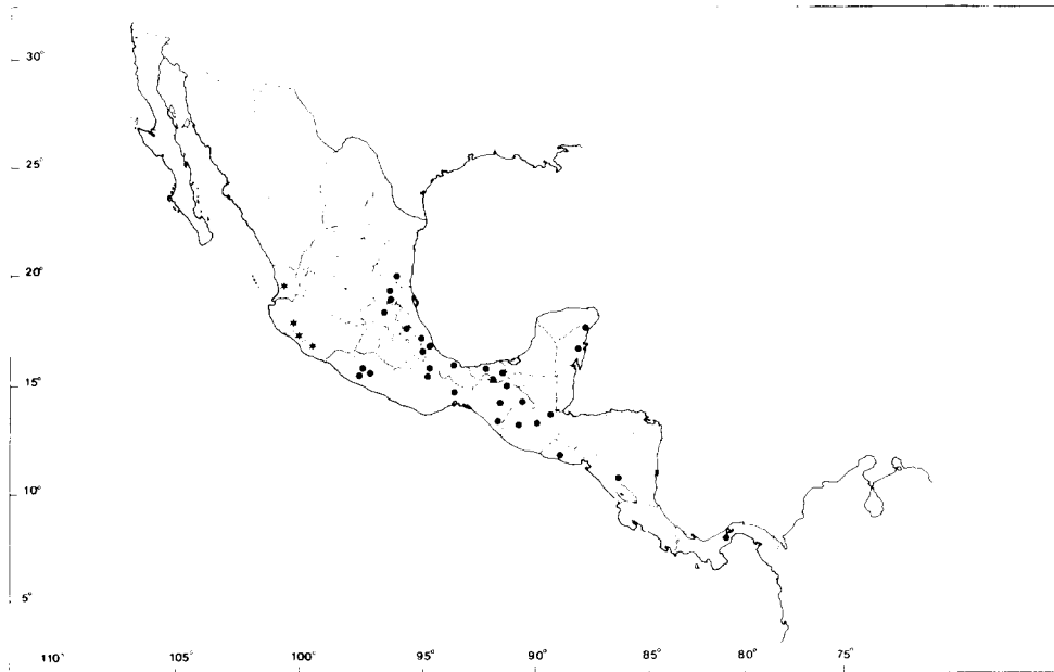
MAPA 1. Área de Distribución de las subespecies de Consul electra . Los triángulos corresponden a C. e. electra , las estrellas son de C. e. castanea Llorente y Luis ssp. nov.

Variación estacional y geográfica. Consul electra es una especie que se distribuye a lo largo de ambas costas en México, desde Chiapas a Nayarit por el Pacífico y desde Chiapas a Tamaulipas por el Golfo (Apéndice 1), además de ocupar Centroamérica hasta Panamá, como se observa en el Mapa. Ocupa un intervalo