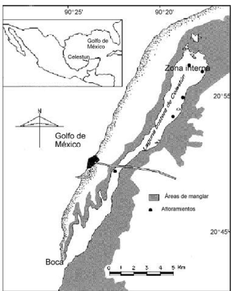
Fig. 1. Localización geográfica de la Reserva de la Biosfera Ría de Celestún.

La variabilidad espacial y temporal del sistema, propician una alta heterogeneidad espacial y una eficiente productividad que hacen de este ambiente físico un hábitat crítico para la protección y desarrollo de estados larvales y juveniles de especies de peces y crustáceos de las áreas costeras de la Plataforma de Yucatán y del Banco de Campeche. Tanto las zonas de pastos y macroalgas, así como las raíces de manglar, son utilizadas por las especies en alguna etapa de su ciclo de vida, como áreas de reproducción, alimentación y protección de los predadores (Vega-Cendejas et al. 1994; Vega-Cendejas 1998).